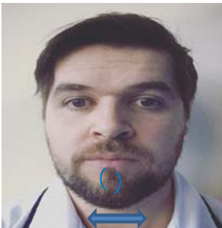
Chin – circles, strokes