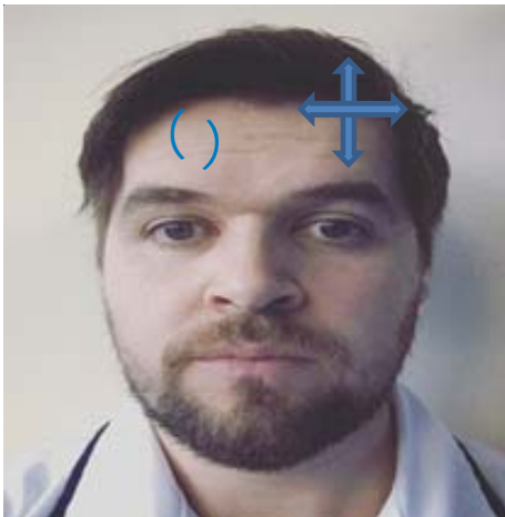
Forehead – circles/ lines vertical/ horizontal